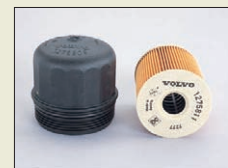
更换滤芯型 (适用于沃尔沃的机油滤油器盖)